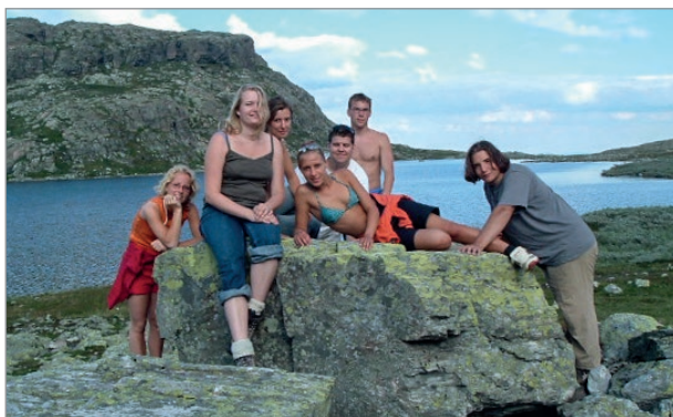
Tur med utenlandske ungdommer til Veslehorn

Studentene fra Gol som har vært utenlands, har også deltatt på et møte, og holdt et foredrag om sitt utenlandsopphold. Vi har inntrykk av at dette året har vært både lærerikt og fullt av nye opplevelser. Mange har fått seg venner for livet ute i verden, så vi oppfordrer alle som har lyst på et slikt utvekslingsår om å søke. Dessuten er det også veldig lærerikt å ha en student fra et annet land boende hos seg i noen måneder.