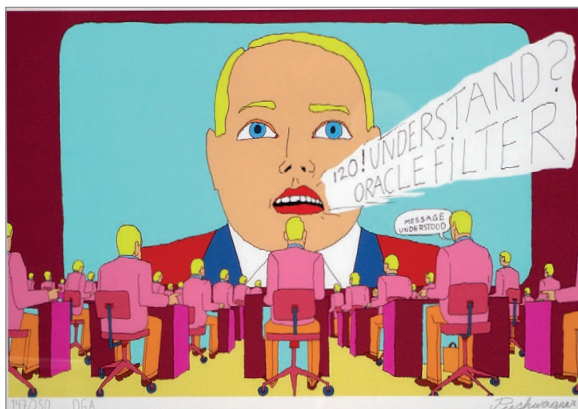
Bilde av Pushwagner som vi hadde på et av kunstlotteriene

Klubben har økonomi nok til at vi kan prioritere å gi en jubileumsgave på kr 50.000.- til den planlagte Sansehagen ved Gol Helsetun. Dette er den største enkeltgaven i klubbens historie. Den er også litt symbolsk med kr 1.000.- for hvert år klubben har eksistert.