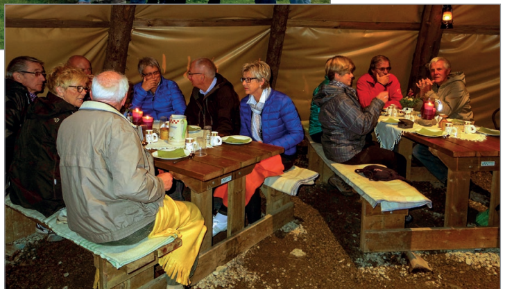
Fra stølsbesøk i lavvo på Trettestølane