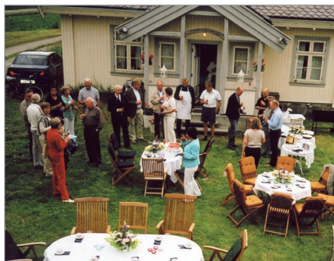
Vi har hatt mange grillfester med presidentskifte i Gamlestugu på Narum

På siste eller nest siste møtet før jul har klubben julemiddag for medlemmene. Da spiser vi julemat og hygger oss.