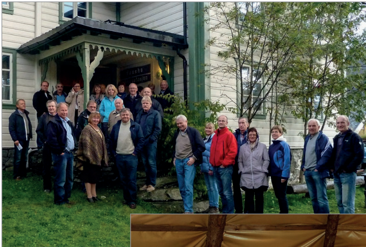
Et av stølsbesøkene var på Fausko i Hemsedal

I slutten av august har vi i mange år hatt stølsbesøk. Det begynte med at vi besøkte hytta eller stølen til en av medlemmene, men de senere årene har disse stølsbesøkene blitt avholdt på mer kommersielle plasser som Fausko, Fagerdalen støl, Vesle Skaugum, Kamben, lavvo på Trettestølane, Lauvsjøstølen og sist høst var vi i «Fjøset» på Tjukketjørr på Torpoåsen.