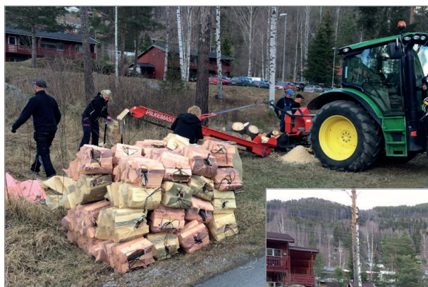
Vedhogging ved Gol Helsetun. Det er i dette området Sansehagen som Gol Rotary gir jubileumsgaven på kr. 50.000,- til, ligger.

ble gitt til Gol Idrettslag til oppstart av lagsavisa Golingen, som fortsatt kommer ut. Vi har utført dugnad i forbindelse med idrettsleker for utviklingshemmede, innsamling av brukte og nye briller til folk i de baltiske landene, gitt støtte til ofrene i Darfur og til Røde Kors sitt arbeide i etterkant av tsunamien i Asia. Dessuten støttet vi Gol Stavkirke med inngangsdør, og dugnadshjelp med skigardbygging ved den restaurerte Heslafoss kraftstasjon.